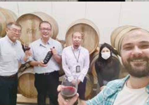
▲ 在モルドバ日本国大使館での勤務風景